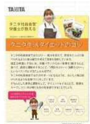
カラー小冊子付き