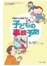
子どもの 事故予防