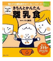
きちんとかんたん 離乳食