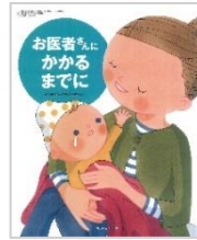
お医者さんにか かるまでに